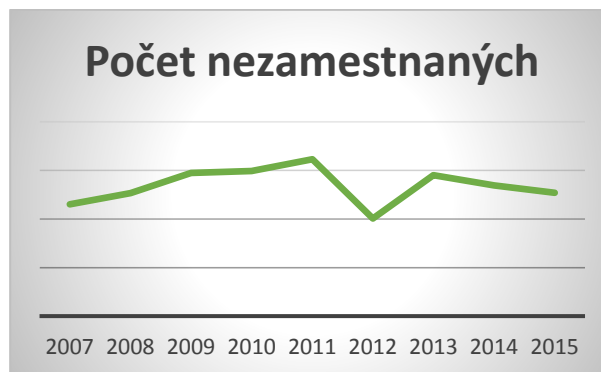
Miera evidovanej nezamestnanosti v okresoch k 31.12..2015